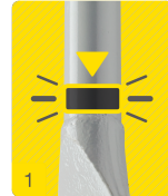
1 Pastille anti-bruit